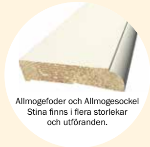
Allmogefoder och Allmogesocker Stina finns i flera storlekar och utföranden.

Stina är det rätta valet för dig som attraheras av både det traditionella utseendet hos en profilerad list och det enkla intrycket av en slät list. Listen är stilren samtidigt som den mjuka avrundningen förhöjer intrycket och ger en genuin känsla. Profilen var ett vanligt inslag i de svenska hemmen under 1920-talet.